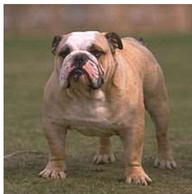
Obrázek 12 Anglický buldok