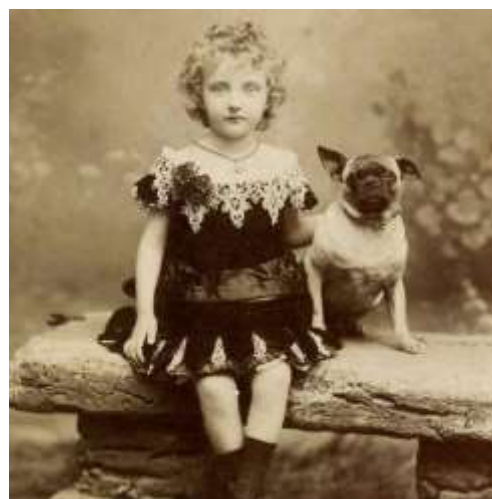
Obrázek 6 Mops s chrtem Obrázek 7 Mops s holčičkou z královské rodiny