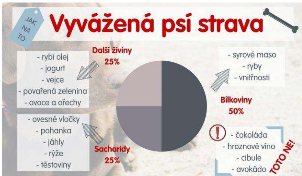
Obrázek 22 Vyvážená psí strava