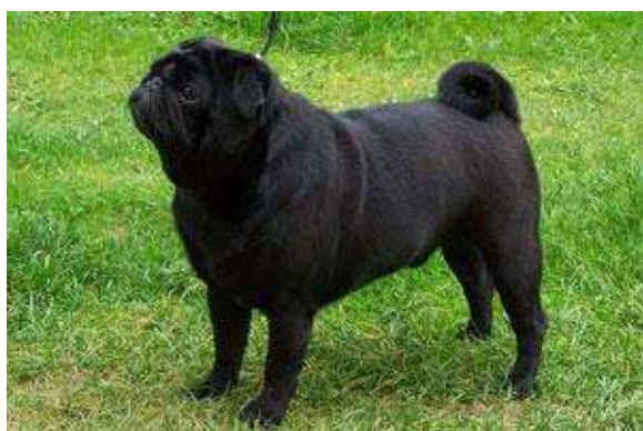
Obrázek 13 Černý mops z boku

Mops je malé plemeno s více druhy srstí, nejčastější barva srsti je stříbrná, apricot, béžová, dále může být mops celý černý. Tlapky, uši a kolem očí s čumákem má zbarvené do černa. Tělo je béžové až stříbrné, končetiny a hlava taktéž. Srst má krátkou, měkkou, hladkou a lesklou. Jeho hlava je kulatá s ušima vysoko po stranách, které bývají sklopené dopředu. Mops má velmi velké, kulaté a černé oči. Má mírný předkus. Tělo je podsadité s rovným hřbetem na středně dlouhých končetinách. Celkově je mops hodně svalnatý s zvrásněnou kůží. Na čele jsou jasně vyjádřené vrásky. Ocásek má zatočený co nejtěsněji u hřbetu.