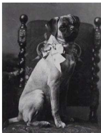
Obrázek 3 Mops Viléma Oranžského 1