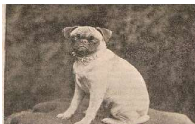
Obrázek 8 Mops na výstavě