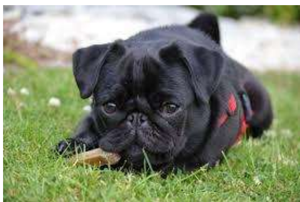
Obrázek 15 Štěně černého mopse