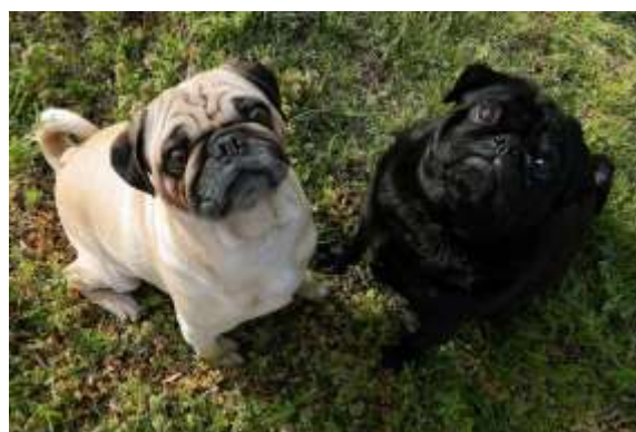
Obrázek 14 Bílý a černý mops