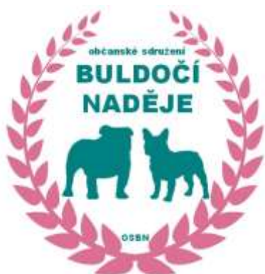
Obrázek 23 Logo OS Buldočí naděje

Odkaz: https://www.instagram.com/buldocinadeje/ https://www.facebook.com/osbuldocinadeje/