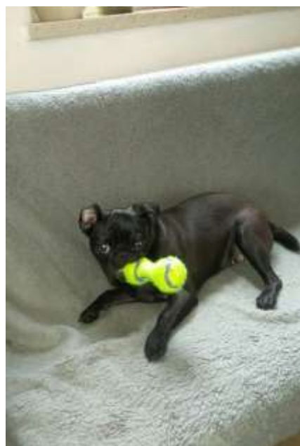
Obrázek 18 Amy