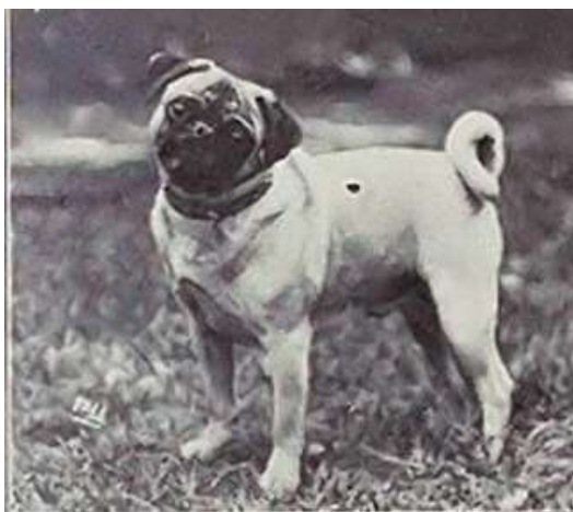
Obrázek 4 Mops přichází do Anglie 1