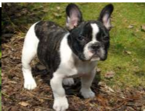
Obrázek 10 Francouzský buldok