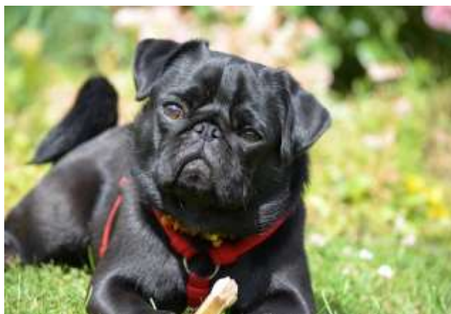
Obrázek 17 Černý mops

Mops má nesmírně mírumilovnou, přátelskou a společenskou povahu. Je to důstojný a inteligentní pes. Tohle plemeno je cílevědomé a silné. Nepatří mezi agresivní psy. Je velice klidný, hravý, čilý, veselý a šťastný pes. Mops má velice rád děti a rád si s nimi hraje. Snese i hlučnou domácnost, třeba i s velkým počtem členů. Velmi dobře se snese i s dalšími domácími mazlíčky. Mops je pohodář a požitkář, trochu pohodlný a ležerní, zároveň i milý a přítulný. Je příjemný domácí společník, který zbytečně neštěká. Sebevědomí mu nechybí. Rozdílnost v chování feny a psa není prakticky žádná. Mops je velice závislý na člověku, v jeho přítomnosti vydává zvuky, které jsou z pravidla znakem spokojenosti. Zbožňuje vítání, a to kohokoliv z rodiny, nebo i cizí návštěvy. Ke svému životu potřebuje každodenní přímý kontakt s lidmi. Je velice žárlivý. Plemeno není určeno na zahradu nebo do kotce.