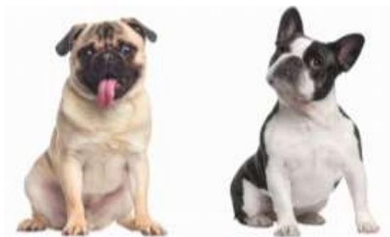
Obrázek 11 Mops a francouzský buldok