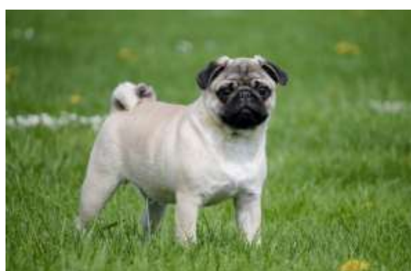
Obrázek 16 Štěně bílého mopse