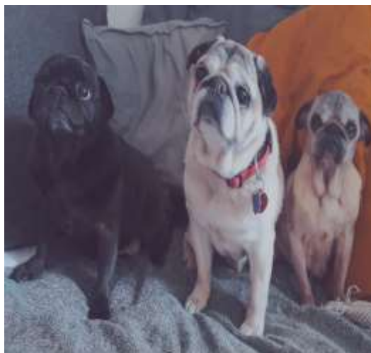
Obrázek 25 Starší mopsíci