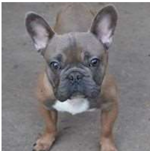
Obrázek 24 Francouzský buldok Dáša