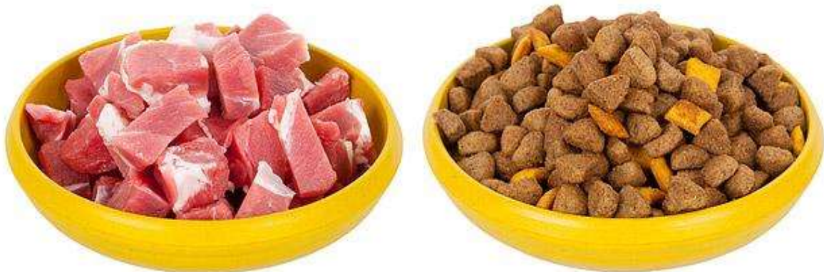
Obrázek 19 Vepřové maso a granule