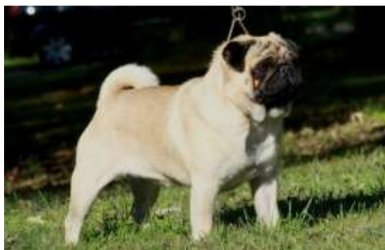
Obrázek 9 Bílý mops z boku

Mops má své kořeny v Číně. Původně se využíval jako společník, dnes jeho využití můžeme označit jako domácí mazlíček nebo třeba rodinný pes. Toto plemeno můžeme zařadit do IX. Skupiny, kam se řadí společenská plemena. Dospělý pes měří asi 25-28 centimetrů a jeho váha je většinou mezi 6,3-9,1 kilogramů. Mops má jemnou, hladkou, měkkou, krátkou a lesklou srst. (Neměla by být ani tvrdá, ani by neměla být jako ovčí srst.) Srst může být různě zbarvená, například: stříbrná, apricot (tj. meruňková), béžová nebo černá. Každá z barev by měla být jasně definovaná, aby byl viditelný kontrast mezi barvou, úhořím pruhem (tzn. tmavou linií táhnoucí se z týla k ocasu) a maskou. Je to pes s velkým šarmem, velice důstojný, inteligentní, vyrovnaný, šťastný a plný života. Většinou se dožívají asi 13 let, záleží na zdravotním stavu daného psa. Mops je zaměnitelný s velice podobným plemenem, a to je Francouzský buldok.