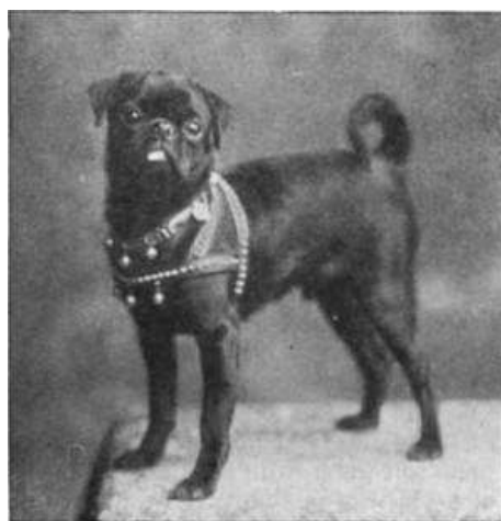
Obrázek 5 černý mops roku 1890