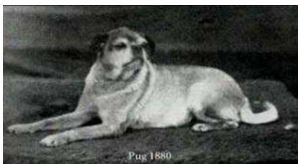
Obrázek 2 Mops z roku 1880

Mops pochází podle všeho z Tibetu, kde byli psi chováni od nepaměti. Uvádí se rok 1700 př.n.l. Historicky první podložený důkaz existence mopse, pochází až z roku 1572 z Holandska. Roku 1572 ostražití mopsové zachránili Viléma Oranžského před atentátem. Vilém I. Oranžský vedl povstání proti španělským Habsburkům. Jednoho večera, když spal se k němu vkradli najatí vrazi španělských Habsburků. Mopsové začali hlasitě štěkat a tím na to upozornili Viléma, který stihl včas utéct. Tím mops ovlivnil Evropské dějiny a v roce 1688 se mops poprvé objevil v Anglii. V 18. století se však objevil v Německu, Rusku, Rakousku, Francii a ve Španělsku. Mopse si oblíbila anglická královna Viktorie, to způsobilo vzrůst jeho popularity. Dnes drží nad tímto plemenem patronát Velká Británie. Na počátku 20. století však mops téměř vymizí.