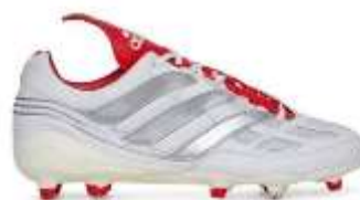
David Beckham a jeho kolekce kopaček predator.