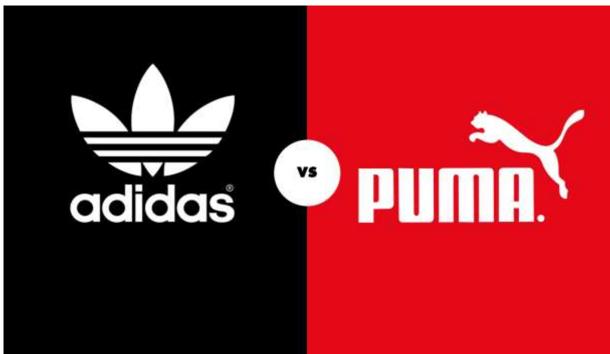
Současné loga značek Adidas a Puma

Firmy se v současné době zaměřují nejen na obuv, ale i na oblečení nebo i kosmetiku a elektroniku.