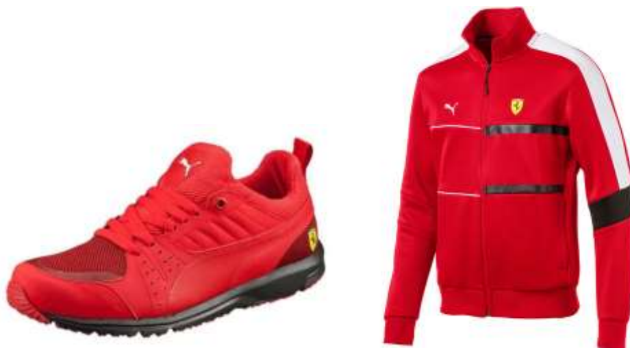
Společná kolekce Pумы a Ferrari

Dále Puma spolupracuje s automobilkou Ferrari. Puma a Ferrari vytvořili společnou kolekci oblečení a bot.