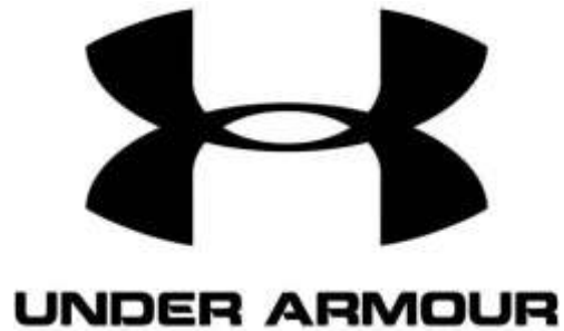
logo Under Armour

Under Armour -tato sportovní značka byla založena teprve nedávno (1996). Under Armour se snaží prorazit do světa a pomalu se jim to daří.