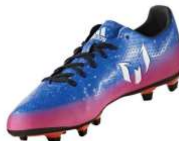
Lionel Messi a jeho kolekce kopaček Nemeziz