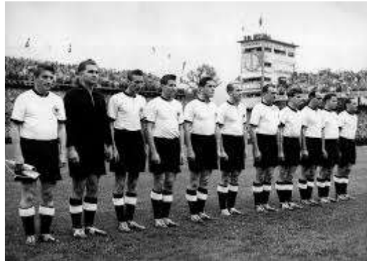
Německá fotbalová reprezentace.

Mistrovství světa v kopané 1954 – první větší „duel“ o sportovce. Těsně před mistrovstvím se Rudolf (Puma) rozhádal s reprezentačním manažerem a kopačky pro hráče nakonec reprezentantům dodal Adolf (Adidas). Německo nakonec senzačně, i díky kopačkám Adidas, získalo titul mistrů světa.