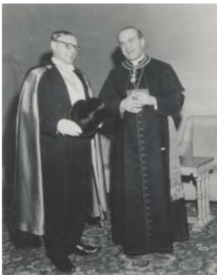
Rytíři