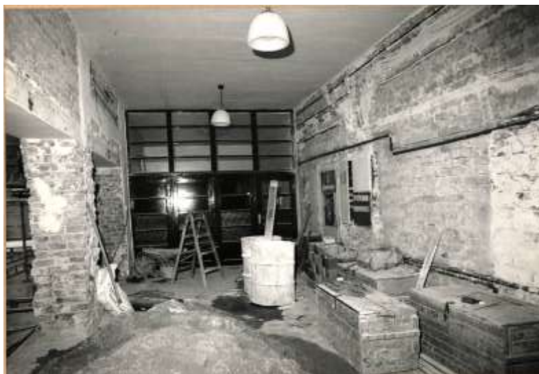
Rekonstrukce Hotelu