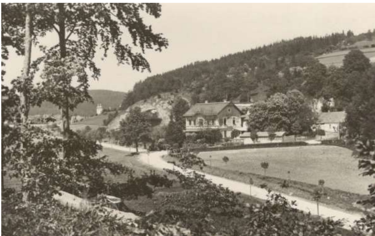
Hotel Broušek I.

Doufám, že se rádi dozvíte něco, o čem jste možná ani nevěděli.