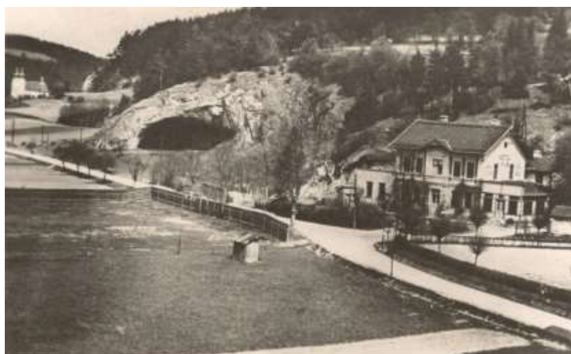
Hotel Broušek s jeskyněmi