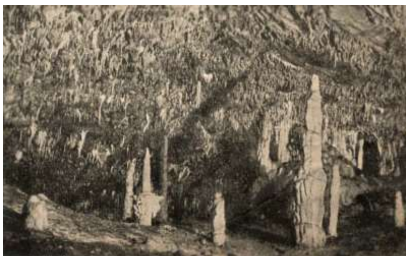
Brouškova síň