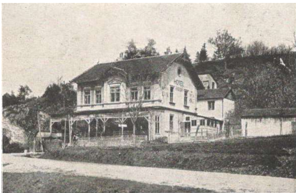
Hotel Broušek II.