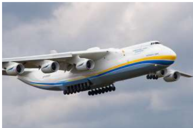
-Antonov 225 Mrija (největší letadlo na světě)