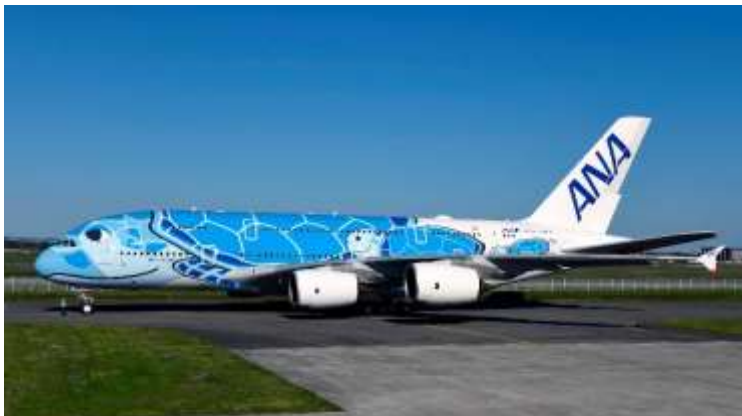
All Nippon Airways A380

Podle mého názoru je škoda, že České aerolinie tento letoun nevyužívají a nevlastní.