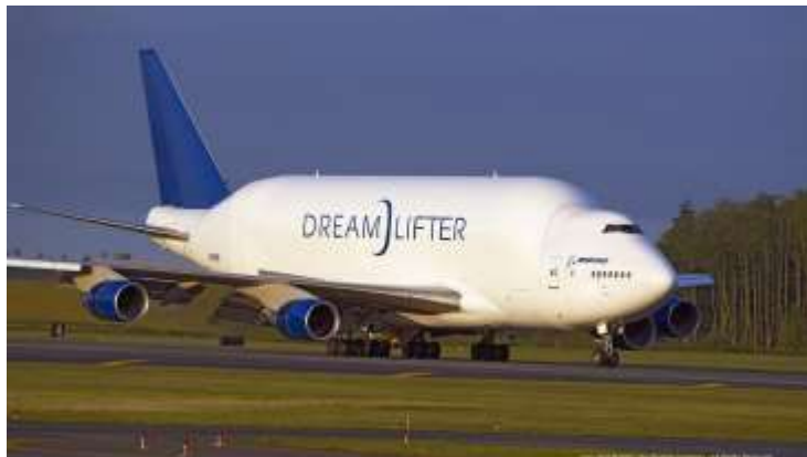
-Boeing 747 Dreamlifter

To, co vás také může překvapit, je jeho délka, která je neuvěřitelných 73 metrů a jeho rozpětí křídel dosahuje asi 80 metrů. Letadlo je vysoké 24,5 metru, což je přibližně výška osmipatrového domu.