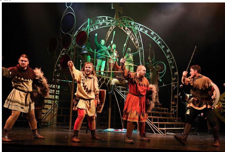
Muzikál Noc na Karlštejně

i další formy a to dialogizované písně (dvojice si připraví a rozehrají příhodu podle dané písně), figurování sloves (všichni zpívají známou píseň, v níž některá slovesa se zpívají nehlasně a nahrazují se ilustrativním pohybem) nebo hledání písně na zadané téma (např. Dospívající kluk zpívá v parku děvčeti, lidé zpívají dopáleně na demonstraci apod.) Dramatizace podporuje cit pro hudebně – dramatický projev, kooperaci, souhru, hravost, fantazii, sebevyjádření a komunikaci. V předcházejícím postupu jsme měli daný text i hudbu, na což navazoval dramatický projev. Může se vyskytnout i opačná situace, kdy máme k dispozici buď pouze text nebo jen hudbu, která o něčem „vypráví“. Takovou hudebně – dramatickou formou, při níž máme zadán jen text nebo hudbu, je hudební pohádka, hra s loutkami, tanec a taneční drama, melodram, hra se zpěvy, opera nebo muzikál . Každá forma nebo postup přináší dětem jednak přiblížení k novým hudebním formám, ale také k odhalení vlastních možností.