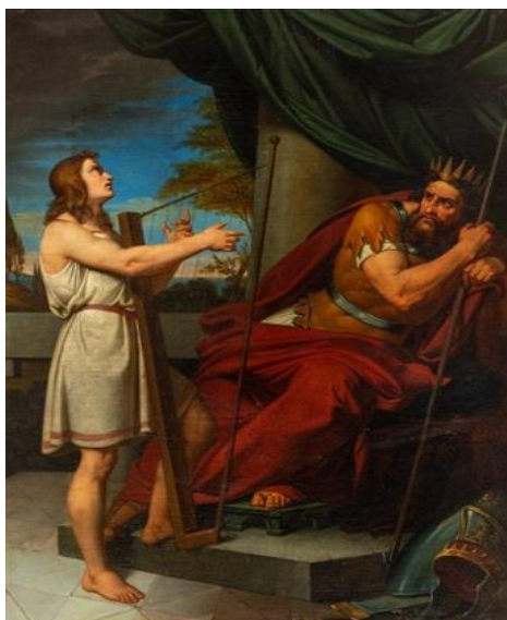
David hraje na harfu:

Chceme-li znát kořeny muzikoterapie, měli bychom vycházet z hudby. Ohlédnout se do prvopočátku a sledovat celkový vývoj hudebního světa. Hudba spatřila světlo světa spolu s člověkem. V období pravěku byly vynalezeny různé druhy hudebních nástrojů, především bicích. Ty pomáhaly vyjádřit funkci, kterou hudba měla. Z pozdější doby jsou známy různé příběhy indiánů, kteří využívali zpěv při léčení zákeřných nemocí. Základem byly tzv. léčebné rituály, do nichž se nemocný zapojoval a spolu s ostatními vytvářel hudbu. Předkové věřili, že jen tak dojdou k uzdravení. Do medicíny se hudební prvek dostává v období starověku. I zde se setkáváme s různými příběhy a legendami, např. biblický příběh o Davidovi uzdravujícího krále Saula hrou na harfu, Homérovy příběhy o Odysseovi a Achillovi. V této době byla hudba považována za jediný lék při kousnutí pavoukem či při uštknutí hadem.