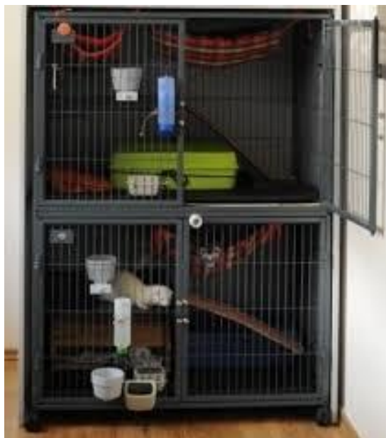
Obrázek 6 – klec

Fretky se rády zahrabávají do pokrývek. Vedle starých ručníků, dek nebo čepic, lze dnes fretkám pro odpočinek pořídit speciální rukávy nebo stany. Hravé chování a pohyb fretek podporují různé doplňky. Mohou to být houpací sítě, závěsné hamaky, případně police umístěné na umělém kmeni nebo konstrukci, po které mohou šplhat. Nezbytné je fretkám zajistit i vhodné hračky. Často se jedná o předměty určené pro psy nebo kočky. Cokoliv fretkám poskytneme, musí být odolné, případně musíme fretky kontrolovat, aby z uvolněných částí něco nepozřeli.