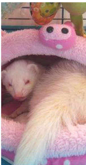
Obrázek 2 – fretka v pelišku

Fretka je velmi společenské a kontaktní zvíře. Podobá se tvrdohlavým psům a kočkám. Znamená to tedy, že jsou schopné reagovat na jméno, ale na zavolání vždy nereagují. Další výhodou frettek je také to, že na rozdíl od psů nejsou fixováni na svého majitele. Nevadí jim samota, protože jsou schopné prospat až 20 hodin denně. Jejich aktivita je v ranních a večerních hodinách. Jsou ale schopny se přizpůsobit a budou aktivní v době, kdy je v domácnosti nejvíce rušno. Je to velmi tichý společník a můžeme u něj zaznamenat pouze syčení v případě rozzlobení nebo drobné pokvokávání, které vypouštějí v okamžiku, kdy se cítí v nebezpečí kvůli zapáchající nažloutlé tekutině. To lze omezit díky čištění záchodku a vykastrováním.