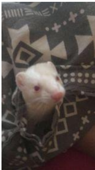
Obrázek 3 – deka