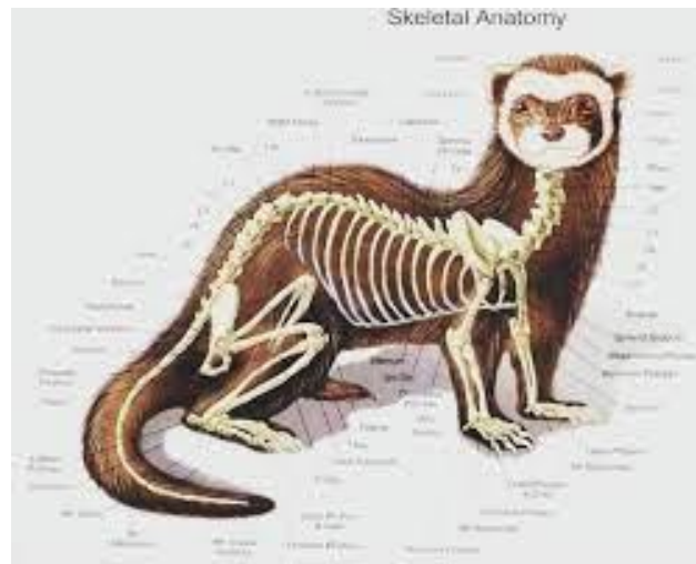
Obrázek 1 - anatomie fretky

Fretky nemají dobře vyvinutý zrak, ale za to jsou obdařeny skvělým sluchem, čichem a hmatovými vousky. Tělo fretky je kryto jemnou podsadou a hrubou dlouhou srstí, což zajišťuje výbornou tepelnou izolaci. Během roku dochází u fretek také k línání, a to vždy na jaře a na podzim. Kostra fretek je lehká a díky tomu pružná. Páteř je velmi pružná a umožňuje fretce otočit se o 180 stupňů i ve velmi stísněných prostorech.