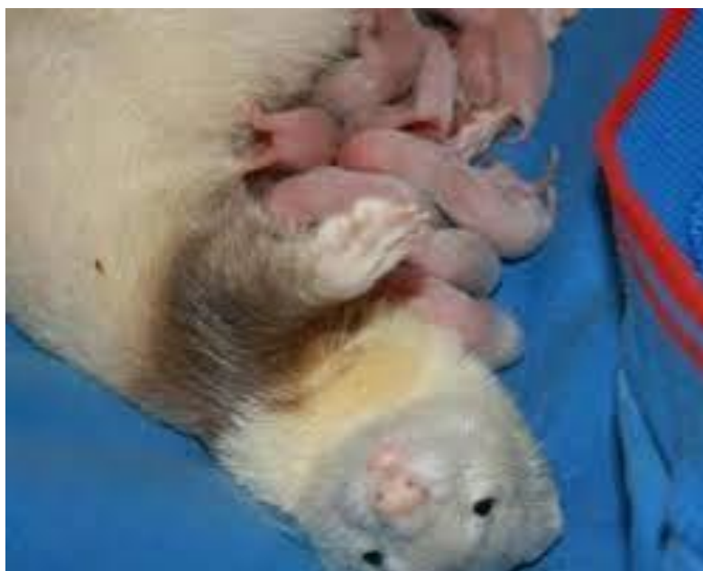
Obrázek 5 – mláďata fretky

Po narození mají fretky velký apetit. Umělý odchov mláďat není snadný. V prvních deseti dnech života je nezbytný přísun fretčího mléka. Od desátého dne se jako náhražka může použít mléko kočičí. Doporučuje se přidavek smetany do obsahu tuku 20 %. Ve čtyřech až pěti týdnech se pak fretkám nabízí mléčná náhražka a granule. Alternativou pro umělý odchov je využít jinou samici.