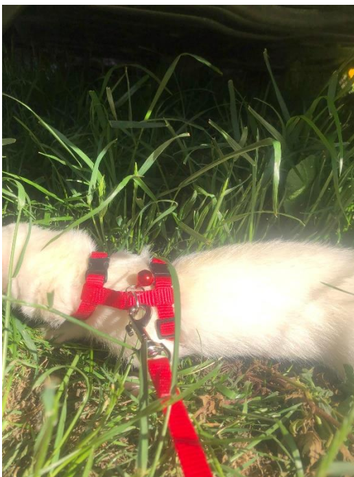
Obrázek 7 – správně připnutý postroj

Pro ochočení je nutný co nejčastější kontakt, který však fretku nesmí obtěžovat. Musí mít dostatek prostoru ke hře i k odpočinku. Základ je samozřejmě hrát si s ní a také ji krmit z ruky, podávat různé pamlsky. Zejména mláďata potřebují v prvních dnech v novém domově společnost. Fretka by si měla od malička zvykat na různé typy lidí, situace i na ostatní zvířata. Fretku lze naučit přivolat na jméno. Vhodná je například hra, kdy stojí v místnosti několik lidí s kousky masa nebo jiné lákavé dobroty a dají ho fretce jen tehdy, když přiběhne na své jméno. Je možné fretku naučit i různým kouskům. Za vhodný pamlsk bude třeba válet sudy nebo přinášet k vašim nohám různé předměty. Fretku lze samozřejmě vzít na procházku s pomocí postroje. Postroj musí být utažený, aby fretka neutekla.