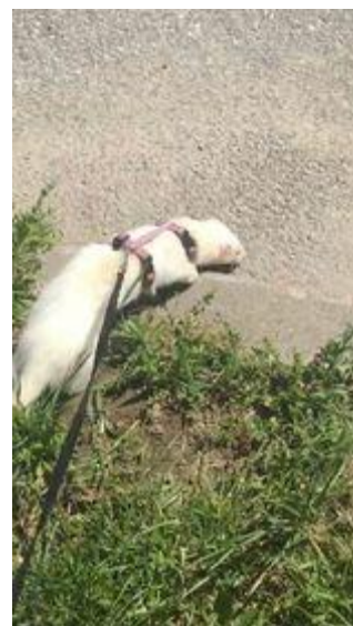
Obrázek 4 - postroj