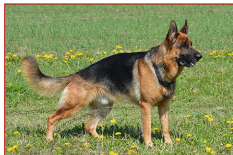
Obrázek 4 – německý ovčák

Toto plemeno je jedno z nejrozšířenějších na světě. Kvůli své všestrannosti je využíváno také jako vodící pes. Tihle psi se můžou stát skvělými policejními psy, ale i báječnými rodinnými společníky.