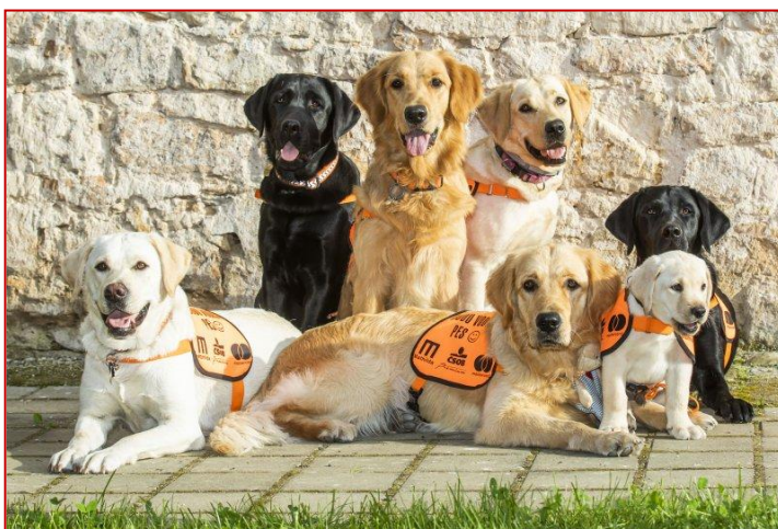
Obrázek 9 – asistenční psi

Odborný výcvik probíhá s každým typem asistenčního psa především podle osobního postižení jeho budoucího majitele. Všichni tito psi musí ale umět některé základní povely. Například u psů pro tělesně postižené to jsou rozsvítit a zhasnout světlo, otevřít a zavřít dveře, přinesení určitého předmětu nebo manipulace s invalidním vozíčkem. U signálních psů to je pak umět reagovat na určité zvuky, jako jsou zvonek, plačící dítě, slyšet na jméno neslyšícího nebo na zvonící budík. Balanční psi jsou zase speciálním výcvikem vedeni k tomu, aby v budoucnu pomocí speciálního postroje pomáhali svému pánovi udržovat rovnováhu. Šikovní společníci jsou pak cvičeni hlavně pro rehabilitaci, canisterapii a psychickou pomoc. Pro canisterapeutické psy je velmi důležitá socializace, také je cvičen k rozšířené poslušnosti a hrám, které může využít při terapii. Canisterapeutičtí psi už od štěněte prochází povahovými a zdravotními testy.