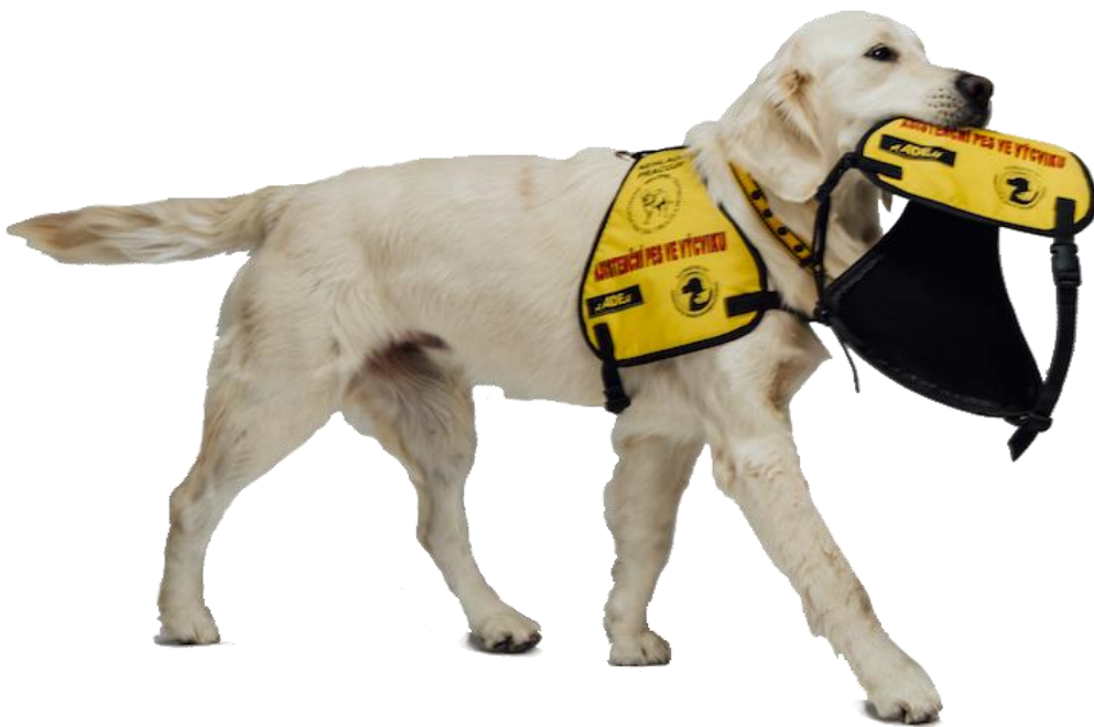
Obrázek 6 – vesta pro asistenční psy ve výcviku

Celkově jsou vodící a asistenční psi určeni pro lidi s nějakým tělesným postižením nebo hendikepem. V dnešní době už existuje hodně způsobů a možností, jak takového psa vycvičit pro téměř každý druh postižení. Asistenční psi také dokážou, kromě vodění člověka z místa na místo, pomáhat udržovat rovnováhu nebo podávat různé věci. Pomáhají člověku začlenit se do běžnějšího života a také po psychické stránce mu jsou velkou oporou.