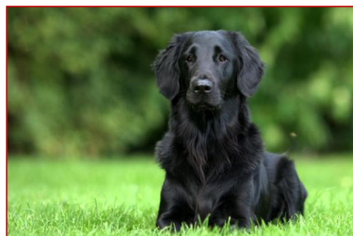
Obrázek 5 – flat coated retrívér

Také se mu říká hladkosrstý retrívér. Je to ideální rodinný pes, je kamarádský, aktivní a není agresivní. Jeho výška v kohoutku je kolem 50 cm. Používají se také jako canisterapeuti. Patří do skupiny retrívérů a vodních psů.