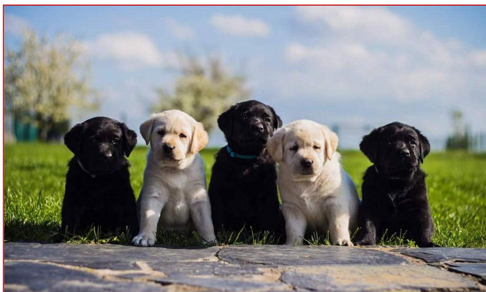
Obrázek 7 – štěňata připravená k výcviku

Výcvik je jedna z nejdůležitějších věcí při přípravě psa pro budoucí práci, ale rozhodně není vůbec lehká. Ještě před tím, než se pes vůbec dostane do odborného výcviku na jakéhokoli asistenčního psa, musí projít dlouhou cestu. Štěně, které je vybráno, že by se v budoucnu mohlo stát vodicím psem, se napřed musí přezkoušet ze základní vhodnosti a absolvovat vyšetření očí a kloubů, ale to není zdaleka vše. Většinou mají odborná cvičiště pár oblíbených chovatelských stanic, ze kterých si vybírají vhodná štěňata. Pokud vybrané štěně projde prvními zkouškami, tak jde na první rok svého života do dobrovolné spolupracující rodiny (tzv. předvýchovy). Tam by se mělo hlavně socializovat, aby z něj nevyrostl agresivní pes. Taková rodina si ovšem musí být také vědoma toho, že tento rodinný společník s nimi nezůstane, brzy odejde a bude nadále cvičen pro hendikepovaného člověka. Během tohoto roku rodina dochází do psí školy na výcvik, kde je štěně učeno hlavně hrou, aby ho to bavilo a mělo z něho radost. Během tohoto roku je stále opakovaně testováno na sílu nervů a chování mezi lidmi. Už tady je hodně psů vyřazeno a v dalším výcviku už nepokračují. Štěně by po odchodu z předvýchovy mělo zvládat základní výcvik, umět sdílet společnou domácnost, jezdit MHD a zvládat městský ruch. Pokud po tomhle období pes projde všemi potřebnými zdravotními testy a vyšetřeními, tak se konečně dostane do odborného výcviku.