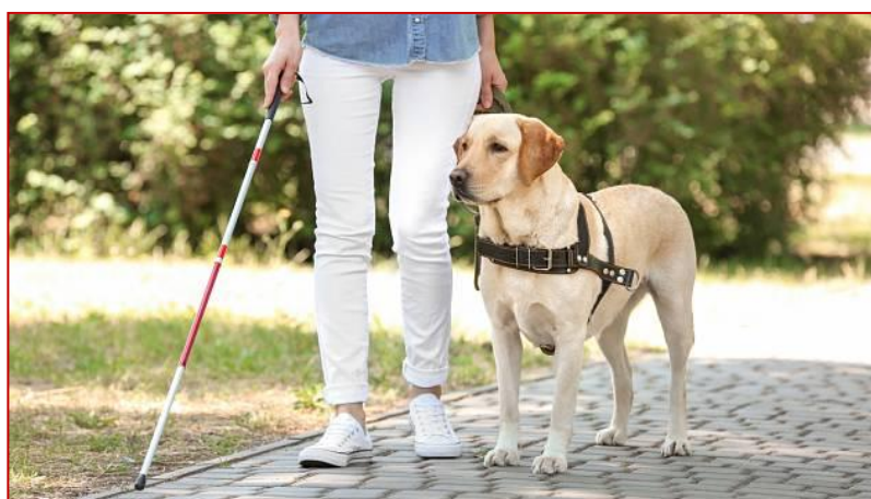
Obrázek 8 – vodicí pes