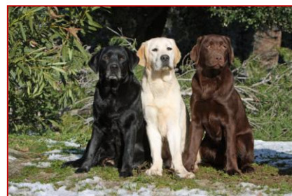
Obrázek 1 – labradorští retrívři

Tohle psí plemeno je nejpoužívanějším vodicím psem v České republice. Je to plemeno, které má průměrnou výšku v kohoutku 57 cm. Retrívři jsou velmi inteligentní, milí, přátelští a vyrovnaní. Při výcviku jsou šťastní, a hlavně se dobře učí. Svému pánovi jsou oddaní.