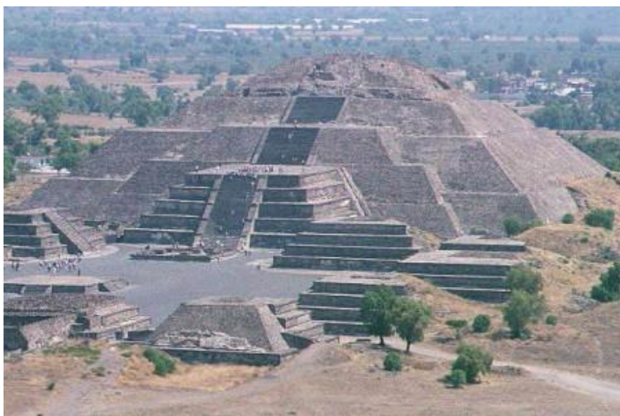
Obr.5: Měsíční pyramida

Nedávné vykopávky odhalily celkem pět pohřebních komor a vědci předpokládají, že se zde nachází i královská hrobka, ta však nebyla dosud objevena.