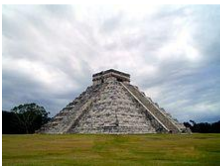
Obr.3: Čínská pyramida

První čínský císař si nechal vybudovat pyramidální hrobku severovýchodně od centra tehdejšího hlavního města říše. Tvarem připomíná egyptské pyramidy. Je postavena především z navezené a upěchované zeminy. Pod pyramidou by se měl nacházet pohřební sál, ale dosud nedošlo k jeho archeologickému průzkumu. Několik desítek podobných pyramid, jakožto hrobek císařské dynastie Západní Chan a vysokých státních funkcionářů, pak bylo vybudováno severozápadně od města, kde tvoří symbolickou ochrannou linii proti mongolským nájezdníkům.