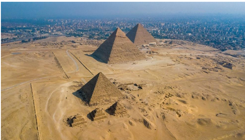
Obr.2: Egyptská pyramida v Gíze

Další nedílnou součástí pyramid v Egyptě je takzvaná Velká sfinga v Gíze. Socha v podobě zvířete je 73,5 m dlouhá a 19,3 m široká, s výškou 20,2 m. Jde o největší sochu vytesanou z jednoho kusu kamene, která kdy byla vytvořena. Její stáří není přesně známo. Někteří egyptologové se domnívají, že sfingu postavili sami Egypťané v 3. tisíciletí př. n. l. v době Staré říše za panování 4. dynastie, a to panovníkem Rachešem.