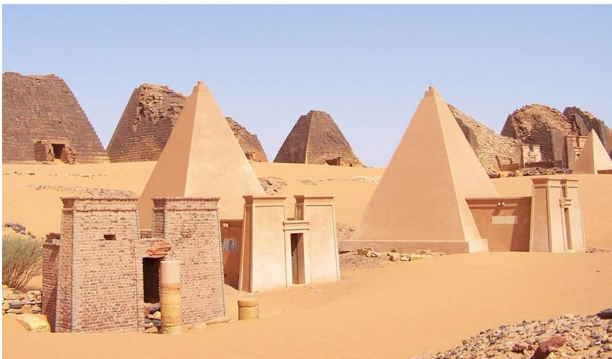
Obr.6: Núbijské pyramidy

První núbijské pyramidy byly postaveny na místě zvaném el-Kurru, jako pohřební místo pro krále Kaštu a jeho syna Pije.